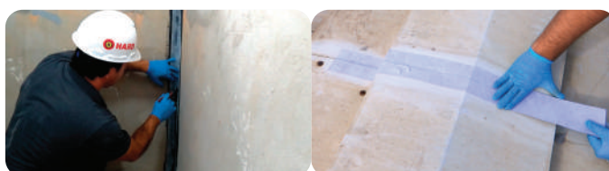
Reforço em pontos críticos de impermeabilização (cantos e arestas) com Flexfelt Standard