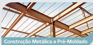
Construção Metálica e Pré-Moldado